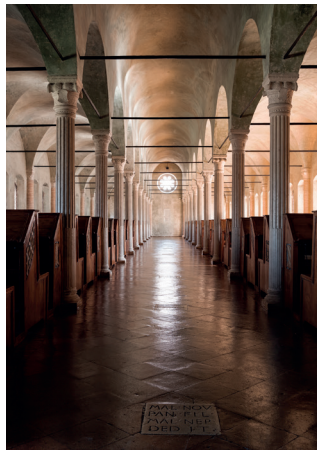
Cesena, Biblioteca Malatestiana, Aula del Nuti.

temporale che va dal Dantedi 2021 e si prolunga sino ai primi mesi del 2022. Gli istituti coinvolti sono: la Biblioteca Comunale Passerini-Landi di Piacenza (che conserva il famoso Landiano 190, codex antiquissimus della Commedia ); la Biblioteca Palatina di Parma; l'Archivio di Stato di Modena; la Biblioteca Estense Universitaria di Modena; l'Archivio di Stato di Bologna (dove sono stati scoperti frammenti e tracce notarili recanti precoci testimonianze dantesche); la Biblioteca Comunale dell'Archiginnasio di Bologna; la Biblioteca Universitaria di Bologna; la Biblioteca Comunale Ariosteana di Ferrara; il Centro Dantesco dei Frati Minori Conventuali di Ravenna; l'Istituto Biblioteca Classense di Ravenna; la Biblioteca Civica “Aurelio Saffi” di Forlì; la Biblioteca Malatestiana di Cesena; la Biblioteca Civica Gambalunga di Rimini. Un catalogo unico (pubblicato da Silvana Editoriale) accompagna il percorso espositivo, con saggi introduttivi a firma di competenti studiosi del mondo accademico e di esperti del patrimonio librario antico e con sezioni specifiche dedicate al posseduto dantesco di ogni istituto coinvolto. Il tutto corredato da schede