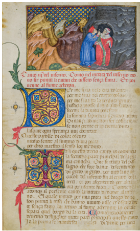
Imola, Biblioteca Comunale, ms. 76. Dante, Commedia .

Preziosi manoscritti delle opere di Dante e varie altre testimonianze storiche, documentarie, letterarie e artistiche dantesche proliferarono rapidamente a partire dal tempo e dai luoghi dell'ultimo esilio del Poeta e sopravvivono ancora oggi nelle biblioteche e negli archivi delle città lungo l'antico asse o al margine della Via Emilia, da Piacenza a Rimini, passando per Parma, Modena, Bologna, Imola, Ferrara, Ravenna, Forlì e Cesena. Per valorizzare questo rilevante patrimonio dantesco, il Servizio Patrimonio culturale della Regione Emilia-Romagna, in collaborazione con la Società Dantesca Italiana, in occasione del settimo centenario della morte di Dante (1321-2021), ha ideato un percorso espositivo diffuso, affinché ciascuna sede di conservazione diventi teatro illustrativo del patrimonio e di iniziative scientifiche e didattiche.