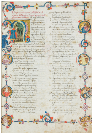
Parma, Biblioteca Palatina, ms. Parm. 3285. Dante, Commedia .