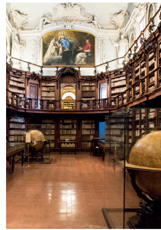
Ravenna, Biblioteca Classense, Aula Magna.

temporale che va dal Dantedi 2021 e si prolunga sino ai primi mesi del 2022. Gli istituti coinvolti sono: la Biblioteca Comunale Passerini-Landi di Piacenza (che conserva il famoso Landiano 190, codex antiquissimus della Commedia ); la Biblioteca Palatina di Parma; l'Archivio di Stato di Modena; la Biblioteca Estense Universitaria di Modena; l'Archivio di Stato di Bologna (dove sono stati scoperti frammenti e tracce notarili recanti precoci testimonianze dantesche); la Biblioteca Comunale dell'Archiginnasio di Bologna; la Biblioteca Universitaria di Bologna; la Biblioteca Comunale Ariosteana di Ferrara; il Centro Dantesco dei Frati Minori Conventuali di Ravenna; l'Istituto Biblioteca Classense di Ravenna; la Biblioteca Civica “Aurelio Saffi” di Forlì; la Biblioteca Malatestiana di Cesena; la Biblioteca Civica Gambalunga di Rimini. Un catalogo unico (pubblicato da Silvana Editoriale) accompagna il percorso espositivo, con saggi introduttivi a firma di competenti studiosi del mondo accademico e di esperti del patrimonio librario antico e con sezioni specifiche dedicate al posseduto dantesco di ogni istituto coinvolto. Il tutto corredato da schede