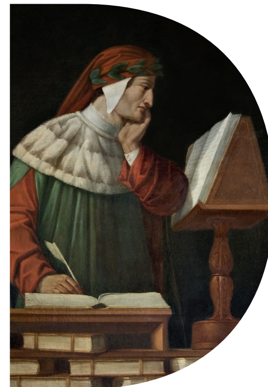
In alto: Piacenza, Biblioteca Passerini-Landi, Codice Landiano , XIV secolo (1336). Particolare dell' Inferno sul fronte: Attilio Runcaldier, Ritratto di Dante (XIX secolo), dettaglio. Ravenna, Istituzione Biblioteca Classense - Museo e Casa Dante

VII centenario della morte di Dante Alighieri (1321-2021)