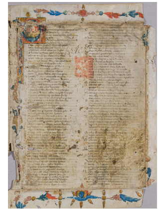
Forlì, Biblioteca Civica “Aurelio Saffi”. Frammento della Commedia .

Palatina, Parma; the Archivio di Stato, Modena; the Biblioteca Estense Universitaria, Modena; the Archivio di Stato, Bologna (where ancient notes by notaries and fragments of Dante’s poetic verses were discovered); the Biblioteca Comunale dell’Archiginnasio, Bologna; the Biblioteca Universitaria, Bologna; the Biblioteca Comunale Ariosteana, Ferrara; the Centro Dantesco dei Frati Minori Conventuali, Ravenna; the Istituto Biblioteca Classense, Ravenna; the Biblioteca Civica “Aurelio Saffi”, Forlì; the Biblioteca Malatestiana, Cesena; and the Biblioteca Civica Gambalunga, Rimini.