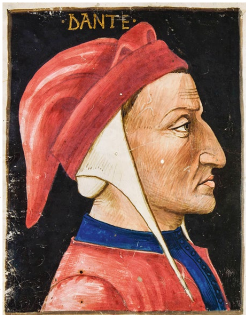
Firenze, Biblioteca Riccardiana, ms. 1040, f. 1v.

Allora come oggi, la Biblioteca Medicea Laurenziana e la Società Dantesca Italiana tornano a collaborare per realizzare insieme alla Biblioteca Nazionale Centrale e alla Biblioteca Riccardiana un grande evento espositivo, allestito nelle tre principali biblioteche pubbliche statali della città.